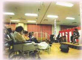
あとRun太スマイルコンサート

11月より火曜日・金曜日の診療となりますので、お間違えないようお願いいたします。