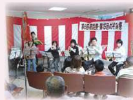
吉田ウィンドアンサンブル演奏