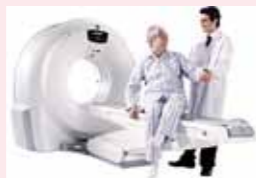
佐々木クリニックホームページより