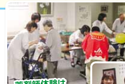
薬剤師体験は誰にでも人気