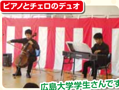
ピアノとチェロのデュオ