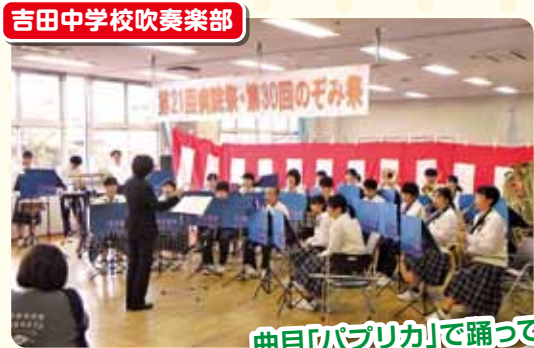
吉田中学校吹奏楽部