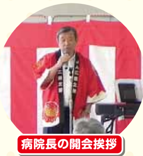
病院長の開会挨拶