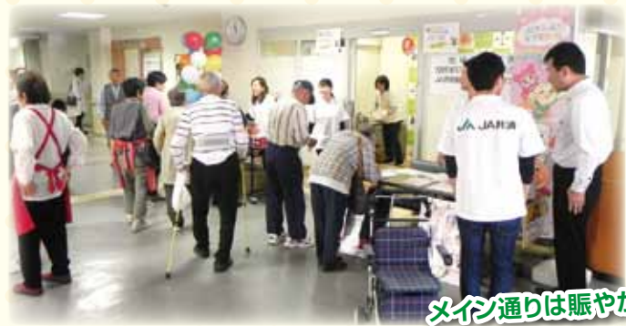
メイン通りは賑やか