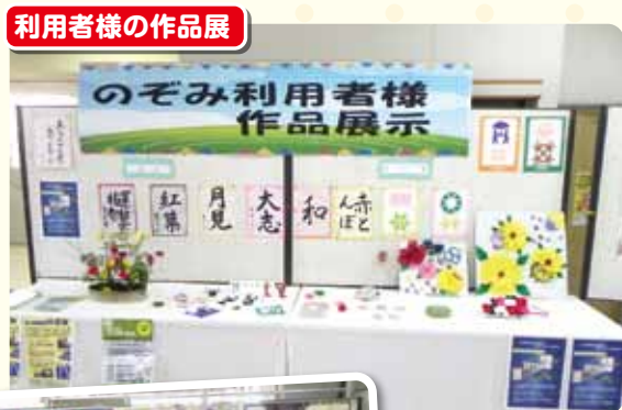
利用者様の作品展