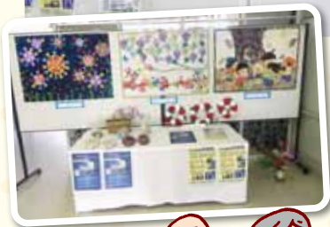
リサイクルバザー