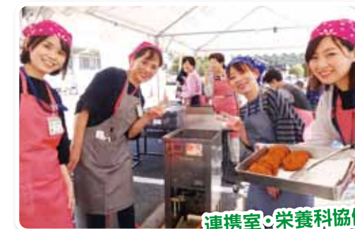
連携室・栄養科協働